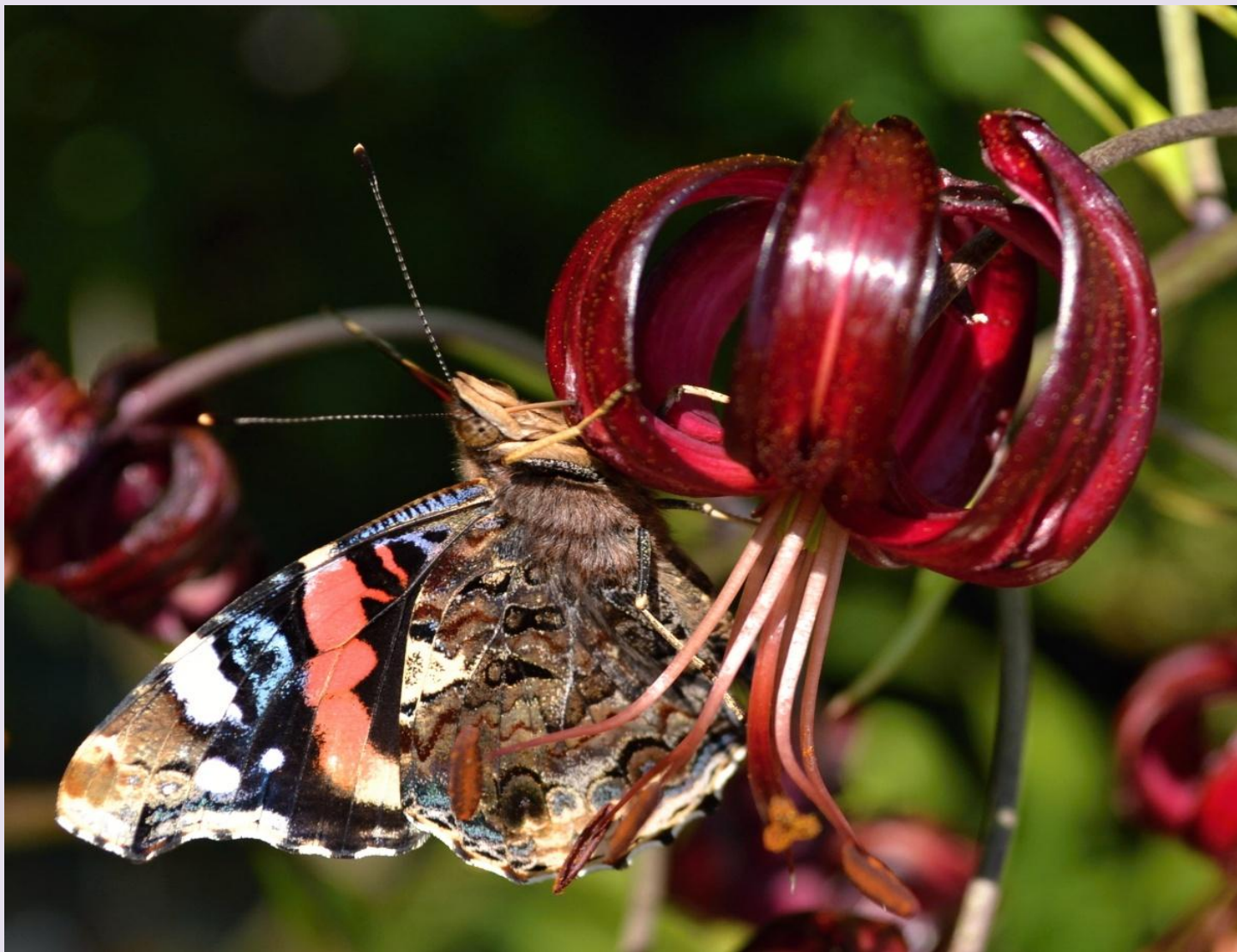
Babočka admirál na L. martagon var. cattaniae