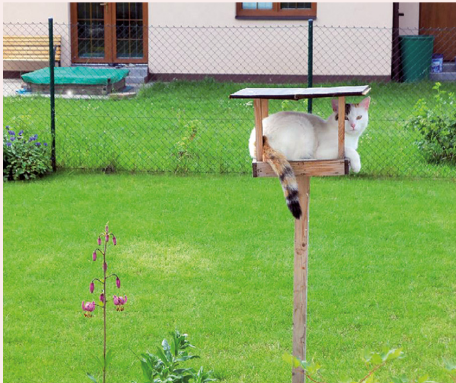
Úspěšný snímek Evy Biedermanové z fotosoutěže r. 2017